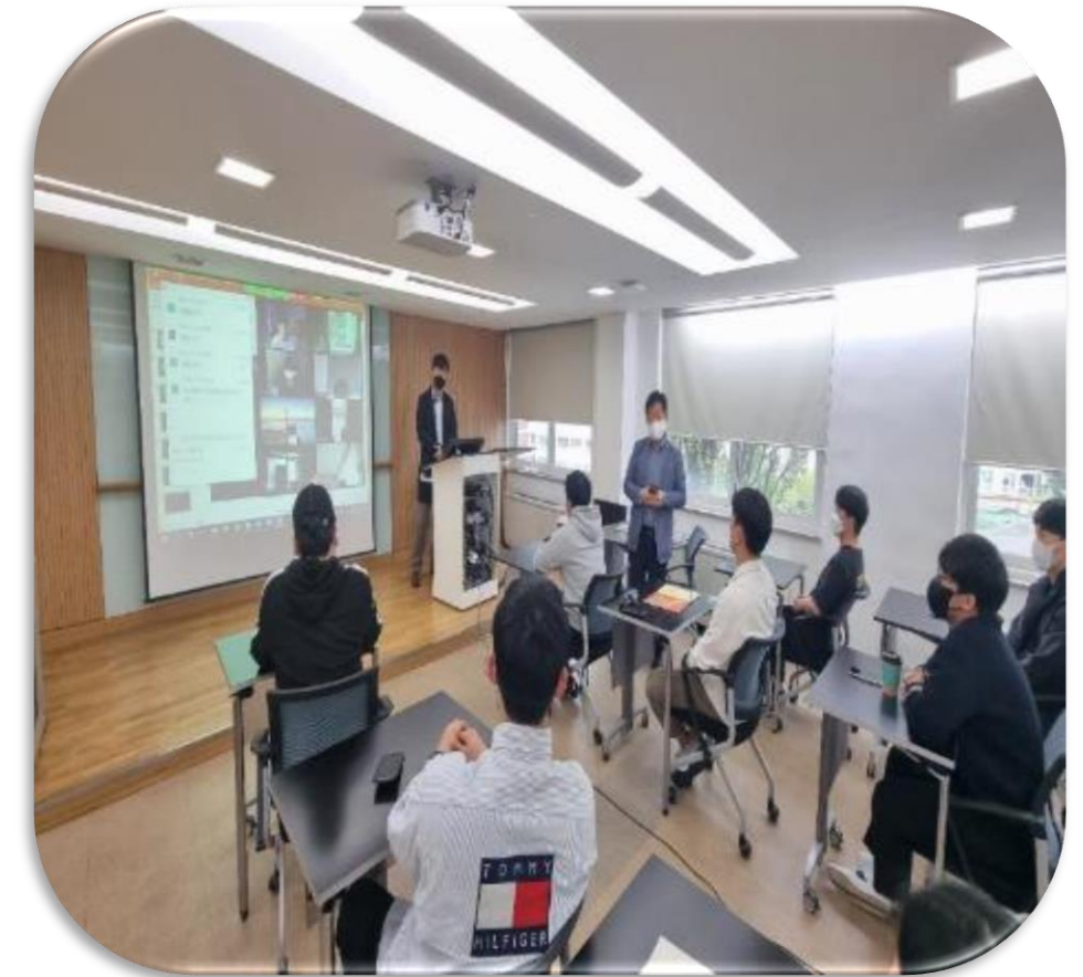
협력사 채용 설명회