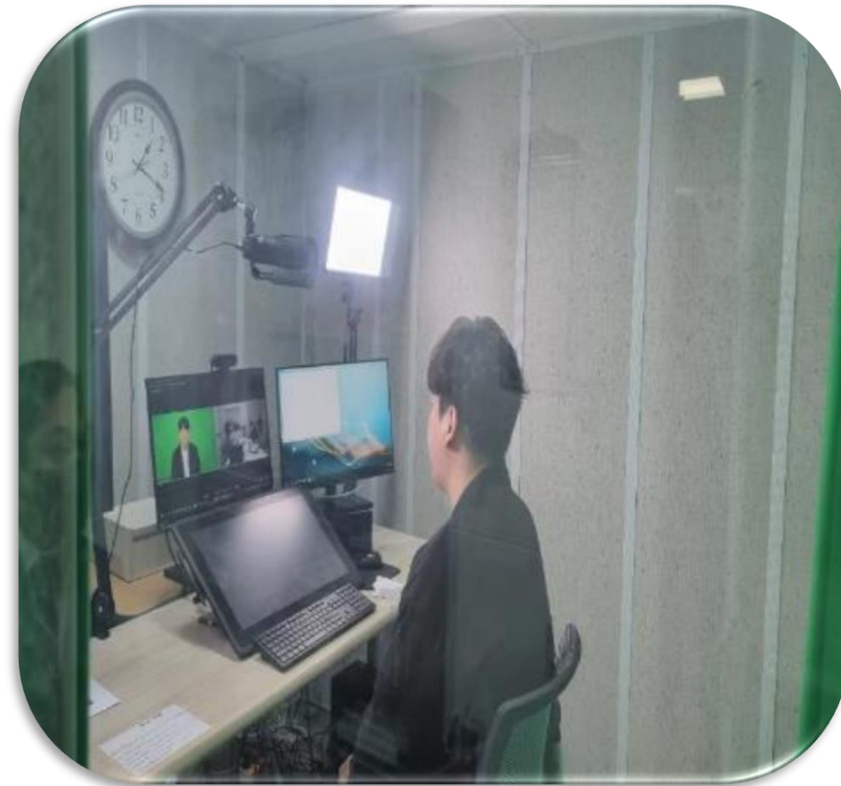
온라인 채용 면접