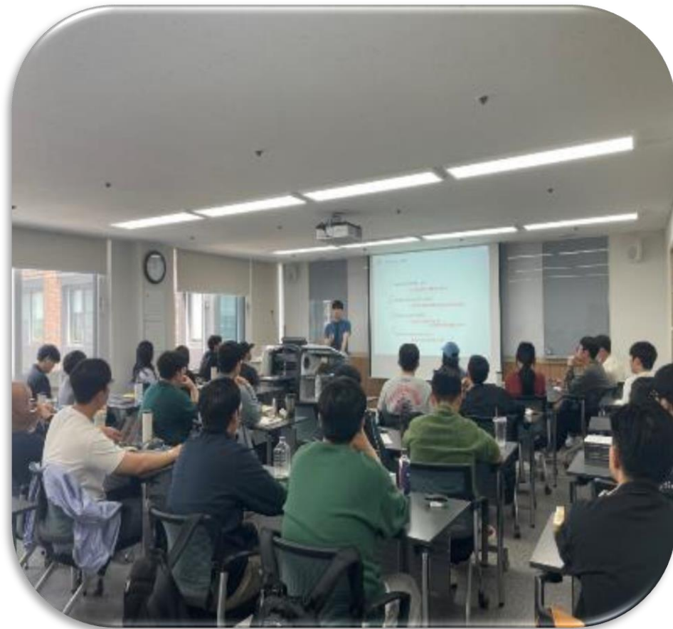
인사실 채용 설명회