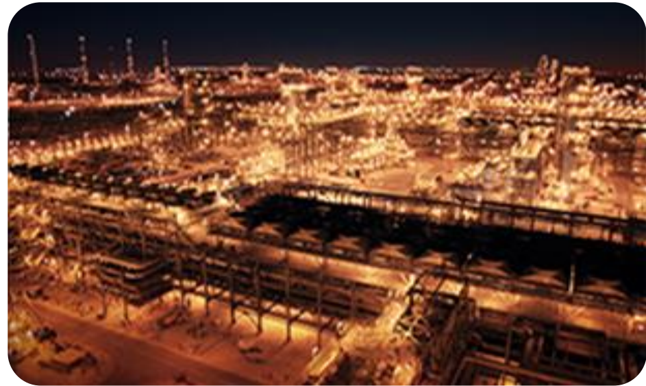
사우디 아미랄 정유공장