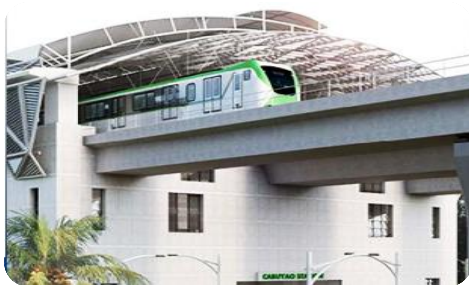
필리핀 마닐라 통근철도