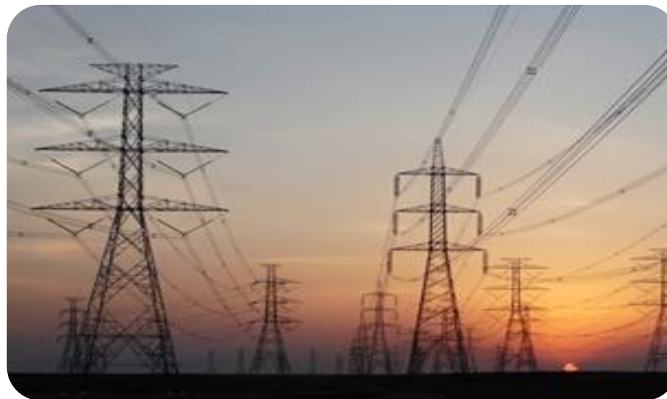
사우디 NIC 송전선로