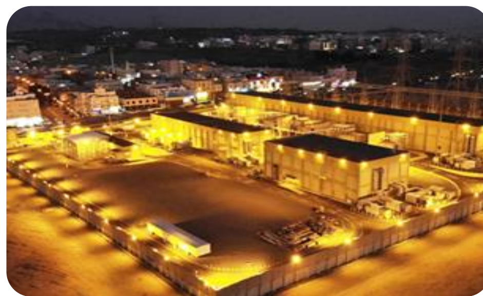
사우디 쇼아이바 변전