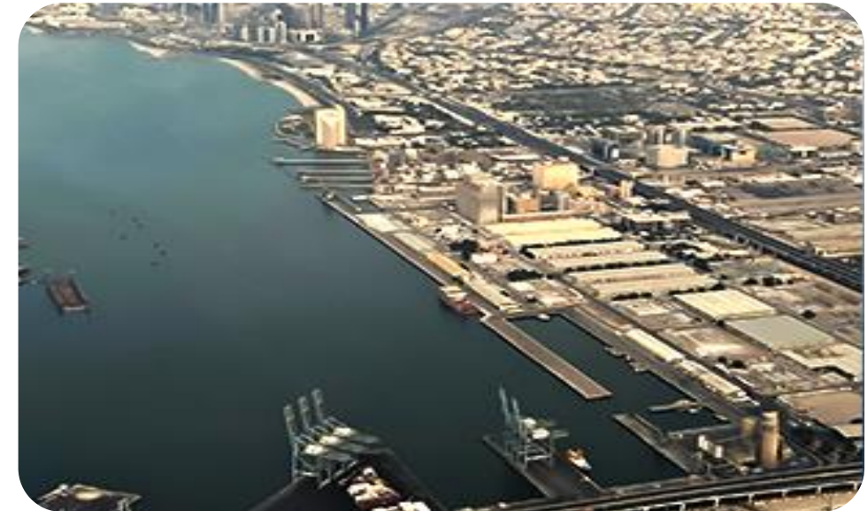
쿠웨이트 슈와이크 항만