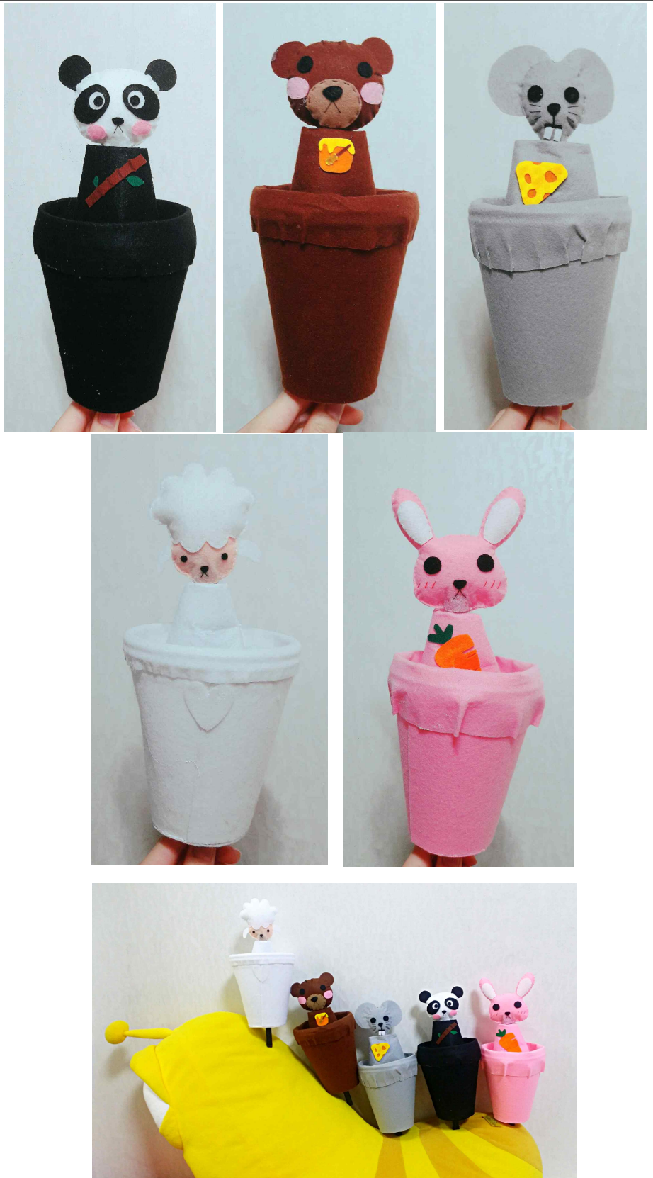
활동 도입 1. 동물 소리를 들려주며 영아의 호기심을 유도한다.